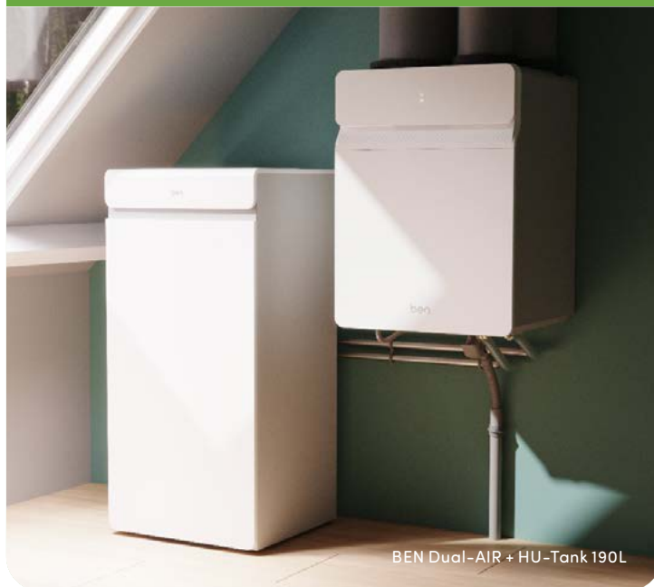
BEN Dual-AIR + HU-Tank 190L