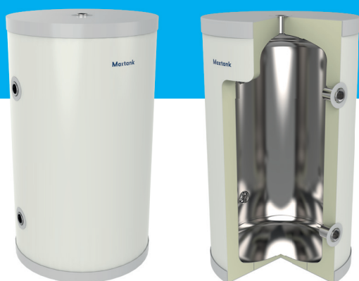
Maxtank BEN buffer 40L (doorsnede)

Interesse in de Maxtank BEN buffer? Scan de QR-code en neem contact op.